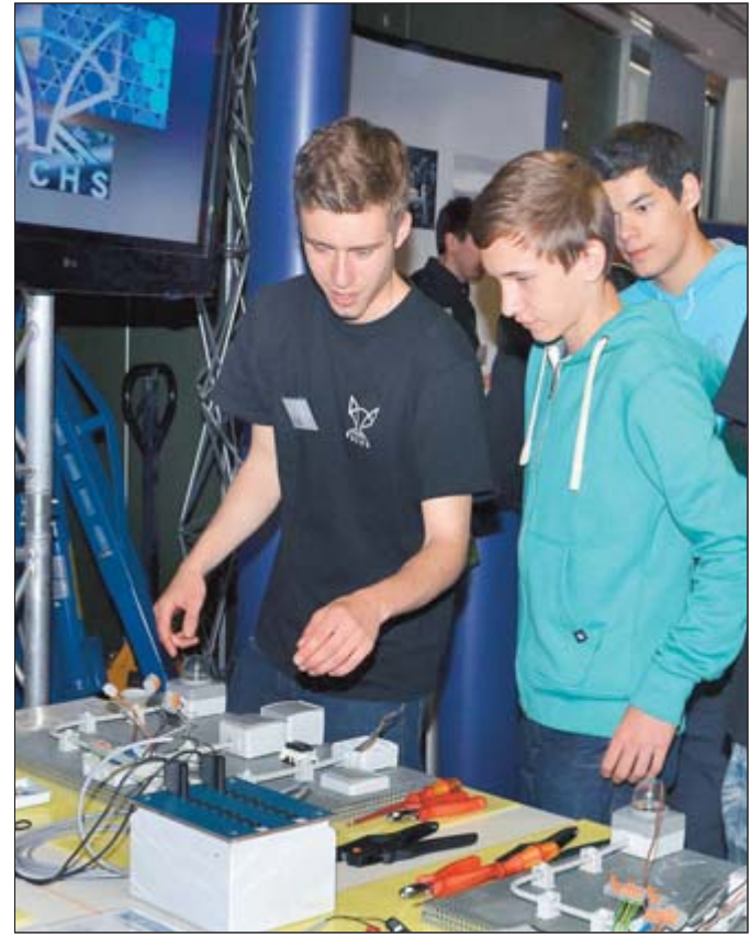
Auszubildende der Unternehmen, hier von Otto Fuchs, geben Einblicke in ihre Arbeit.