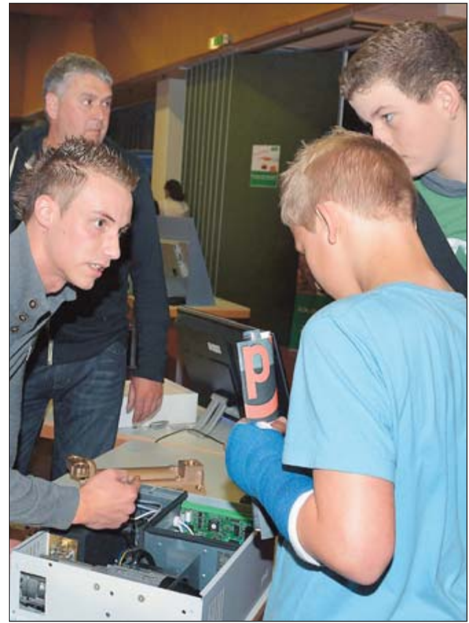
An den unterschiedlichen Ständen, hier der letztjährige Stand der Firma gwk, gibt es für die Jugendlichen Informationen aus erster Hand.